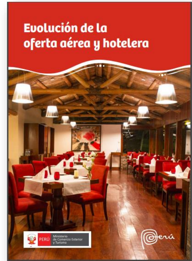
Evolución de la oferta aérea y hotelera