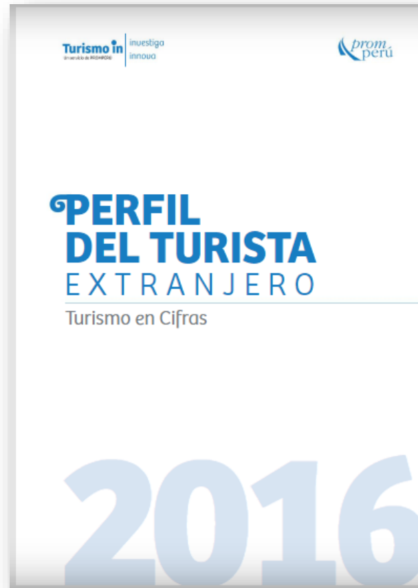
Perfil del vacacionista extranjero